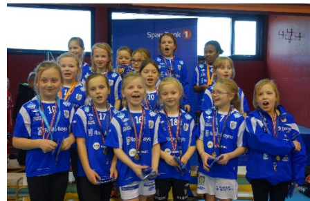
2005-modellar på turnering i februar 2014