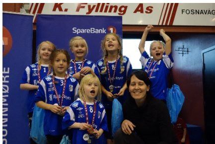
2006-modellar på turnering i november 2013

Jentene (2005/2006) har delteke på to miniturneringar i Herøyhallen (10. november 2013 og 10. februar 2014). Det var kjekt å vere på turnering. Flinker jenter.